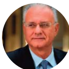
On. GIANLUCA SUSTA Senatore XVII Legislatura della Repubblica Italiana