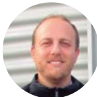
PROCORO DEL REAL Architetto Ras Arquitectos Solution SL, Elche, ALICANTE