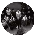
STEFANO BOERI ARCHITETTI MILANO